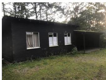
EGEKRATTET FØR 2020

I løbet af aftenen skal vi have fundet årets EGEKRATMESTER i at rafle, så mød op og bliv en del af en kommende tradition m. råhygge!