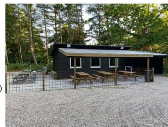
EGEKRATTET anno 2023